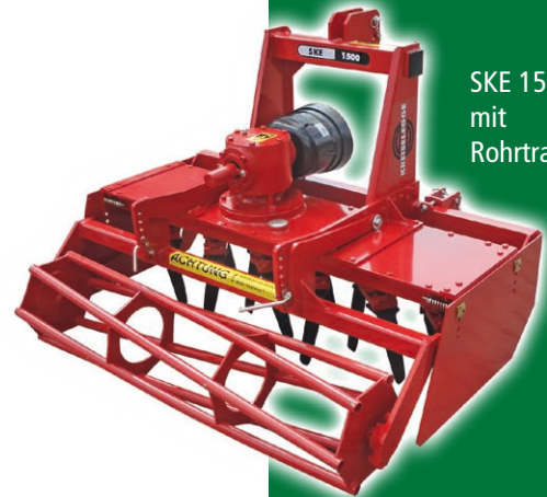
SKE 1500 mit Rohrtragwalze