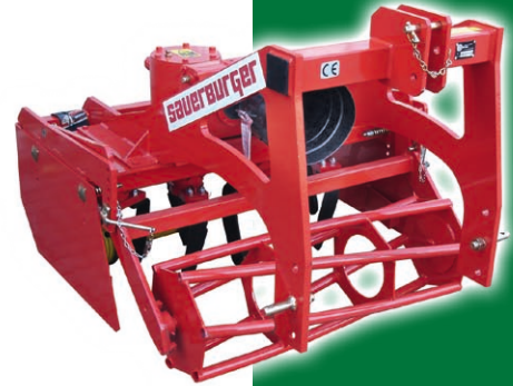
SKE 1000 Frontanbau