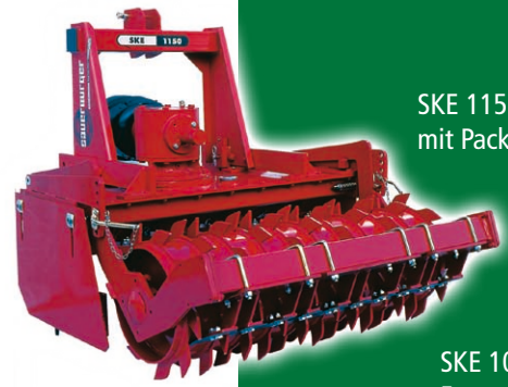
SKE 1150 mit Packerwalze