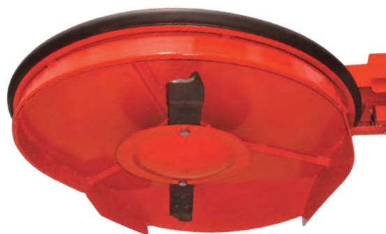
Gleitteller unter der Schwenkscheibe verhindert eine Verletzung der Grasnarbe