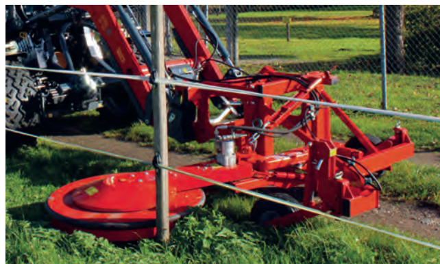
ILTIS 2000 Front, hydraulisch angetrieben im Einsatz an einem Grip4-140 mit Frontlader

Frontanbau: Anhängung für FXS-Schnellwechsler • Anhängung für Euro 8-Schnellwechsler • geschraubte Aufnahme für unterschiedliche Hersteller • Hydraulischer Einzug (benötigter Anschluss: 1 x EW)